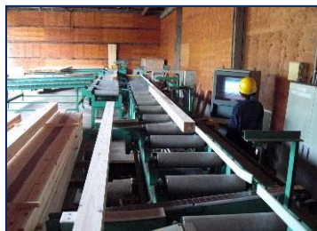
グレーディングマシン(強度)